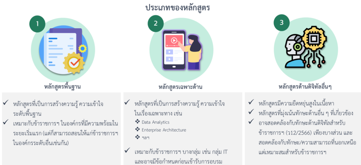
รูปที่ 2.1: ประเภทของหลักสูตร/โมดูล

ด้วยความต้องการพัฒนาทักษะด้านดิจิทัลของข้าราชการและบุคลากรภาครัฐจำนวนมาก รวมถึงความหลากหลายของหลักสูตร/โมดูลด้านดิจิทัล และความสามารถของสถาบันอบรมที่มีความแตกต่างกัน การจัดกลุ่มประเภทของหลักสูตร/โมดูลตามความซับซ้อนและหัวข้อของหลักสูตร/โมดูลจะทำให้ สดช. สามารถจัดการกระบวนการในการรับรองหลักสูตร/โมดูลได้อย่างมีประสิทธิภาพ เช่น การจัดหาผู้ประเมิน หรือการบริหารจัดการทรัพยากรในการประเมินได้อย่างเหมาะสม และเพื่อให้เกิดความยืดหยุ่นในการจัดทำหลักสูตร/โมดูล ที่จะใช้ในการพัฒนาทักษะดิจิทัลให้กับข้าราชการและบุคลากรภาครัฐจำนวนกว่าสามล้านคนทั่วประเทศ ในกรอบระยะเวลาที่กำหนด ทั้งนี้ สดช. ได้กำหนดประเภทของหลักสูตร/โมดูลที่หน่วยงานภาครัฐที่มีพันธกิจในการจัดอบรม สถาบันการศึกษา หรือสถาบันอบรมเอกชนอื่น ๆ สามารถนำเสนอได้ 3 ประเภทดังต่อไปนี้