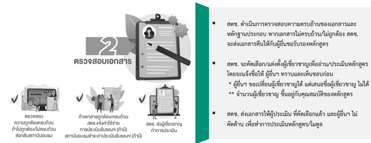
รูปที่ 3.3: ขั้นตอนที่ 2 การตรวจสอบเอกสาร

ขั้นตอนที่ 2 เมื่อ สดข. ได้รับเอกสารจากผู้ยื่นคำขอแล้ว สดข. จะดำเนินการตรวจสอบความครบถ้วนของเอกสารและหลักฐานประกอบ โดยใช้เวลาในการตรวจสอบความครบถ้วนของเอกสารภายใน 3-7 วัน ขึ้นอยู่กับประเภท คุณลักษณะ และรูปแบบการจัดอบรมของหลักสูตร/โมดูล โดย