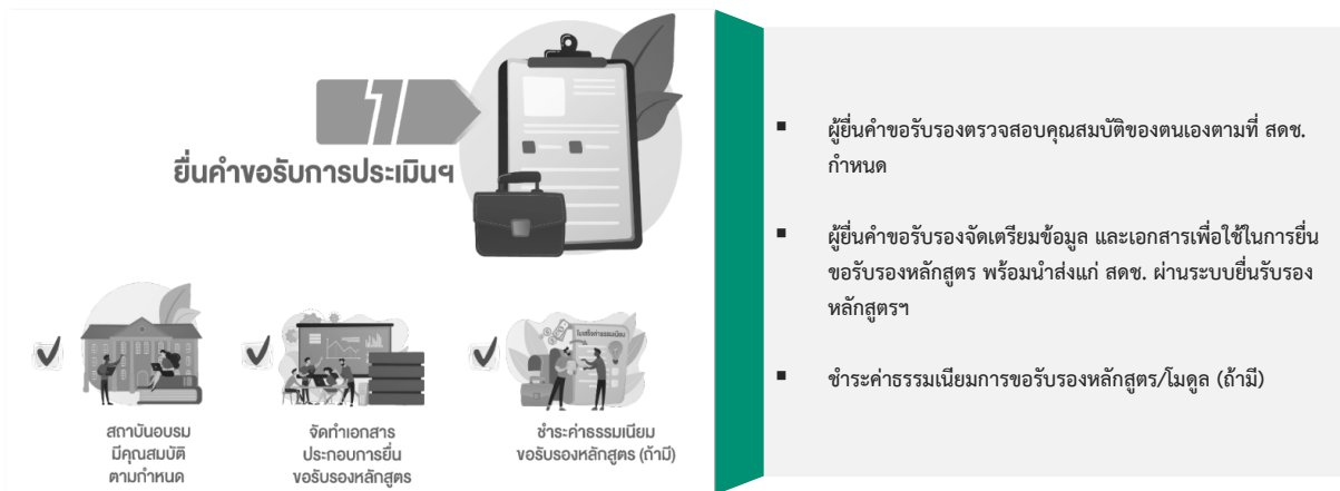
รูปที่ 3.2: ขั้นตอนที่ 1 การยื่นขอรับการประเมิน

ขั้นตอนที่ 1 สถาบันอบรมที่มีคุณสมบัติตามที่ สดช. กำหนด ที่ต้องการยื่นขอรับการประเมินเพื่อรับรองหลักสูตรฯ/โมดูล จัดทำเอกสารแบบยื่นขอรับการประเมินเพื่อรับรองหลักสูตร/โมดูล พร้อมหลักฐานประกอบตามที่ สดช. กำหนด และชำระค่าธรรมเนียมการขอรับรองหลักสูตร/โมดูลตามอัตราที่ สดช. กำหนด (ถ้ามี) ทั้งนี้ หน่วยงานที่ประสงค์ยื่นขอรับการประเมินเพื่อรับรองหลักสูตร/โมดูล จะต้องศึกษาคู่มือสำหรับการยื่นรับรองหลักสูตร/โมดูลให้เข้าใจ และยื่นขอรับรองหลักสูตร/โมดูลอย่างถูกต้องตามขั้นตอนที่กำหนด