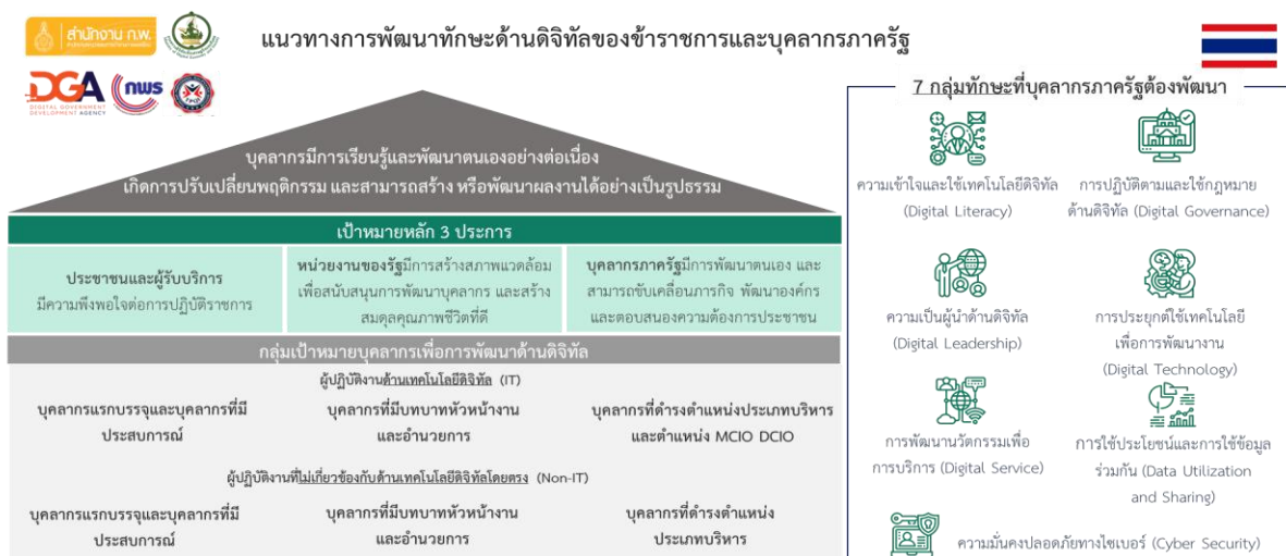
รูปที่ 1.1: แนวทางการพัฒนาทักษะดิจิทัลของข้าราชการและบุคลากรภาครัฐ

สำนักงาน ก.พ. จึงได้จัดทำแนวทางการพัฒนาบุคลากรภาครัฐ พ.ศ. 2566 – 2570 ขึ้น โดยมีเป้าหมายการพัฒนาบุคลากรภาครัฐ 3 เป้าหมาย ได้แก่ 1) ประชาชนและผู้รับบริการ มีความพึงพอใจต่อการปฏิบัติราชการ 2) หน่วยงานของรัฐมีการสร้างสภาพแวดล้อมเพื่อสนับสนุนการพัฒนาบุคลากร และสร้างสมดุลคุณภาพชีวิตที่ดี และ 3) บุคลากรภาครัฐมีการพัฒนาตนเอง และสามารถขับเคลื่อนภารกิจ พัฒนางค์กร และตอบสนองความต้องการประชาชน