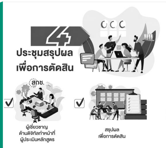
รูปที่ 3.6: ขั้นตอนที่ 4 การประชุมสรุปผลเพื่อการตัดสิน

ขั้นตอนที่ 4 สตช. สตช. ทำการรวบรวมผลการตรวจประเมินของผู้ประเมิน ส่งให้คณะกรรมการรับรองหลักสูตร/โมดูลการพัฒนากำลังคนด้านดิจิทัล และประสานงานคณะกรรมการฯ เพื่อจัดประชุมเพื่อพิจารณาตัดสินและรับรองหลักสูตร/โมดูล